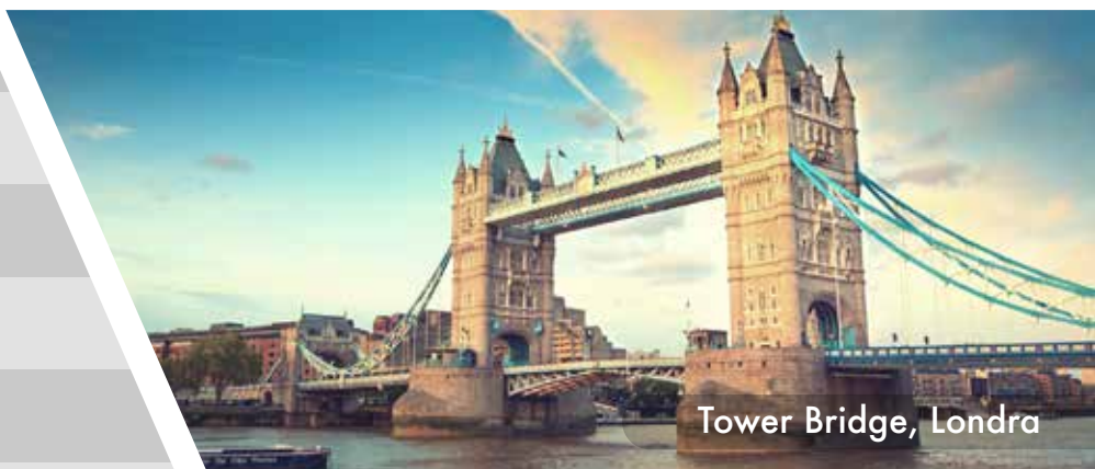
Tower Bridge, Londra