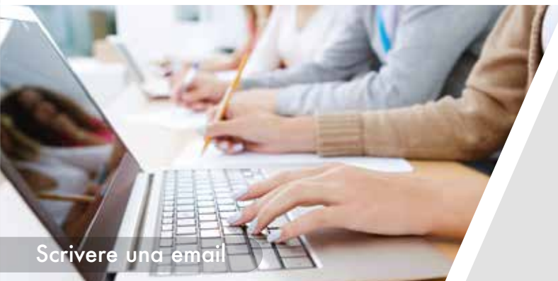
Scrivere una email

Il corso prevede 15 ore di lezione in classe e diversi seminari e workshop pomeridiani alternati al tempo libero.