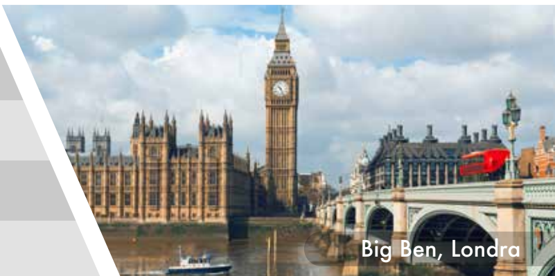
Big Ben, Londra