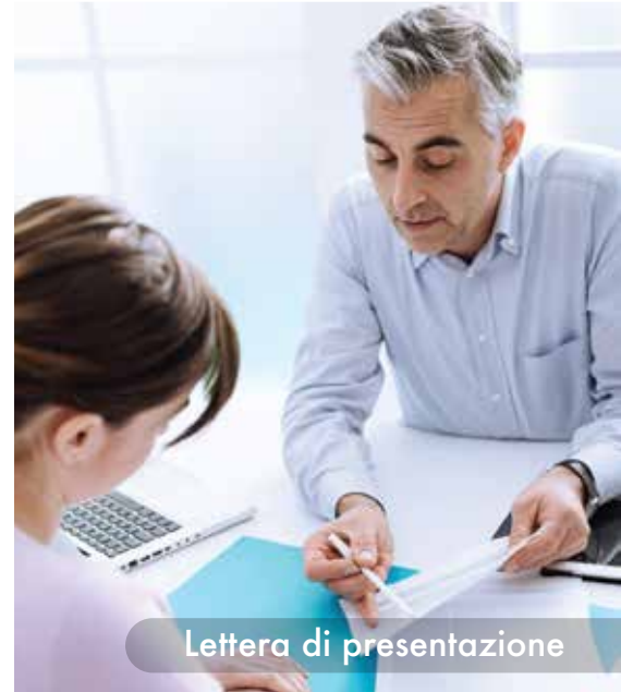
Lettera di presentazione