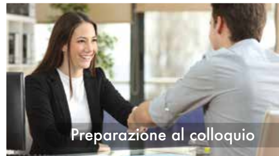
Preparazione al colloquio