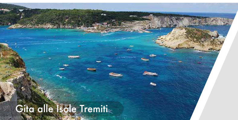
Gita alle Isole Tremiti

Durante il Summer Camp i bambini avranno l'opportunità di sperimentare un contatto diretto con la lingua inglese, grazie ad insegnanti madrelingua, in un ambiente sereno, stimolante e divertente.