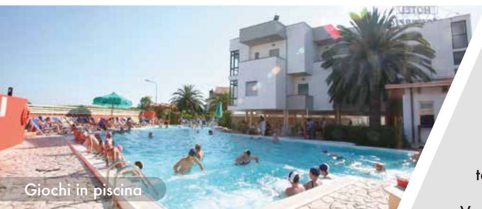
Giochi in piscina