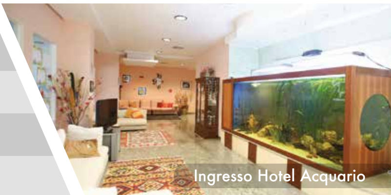
Ingresso Hotel Acquario