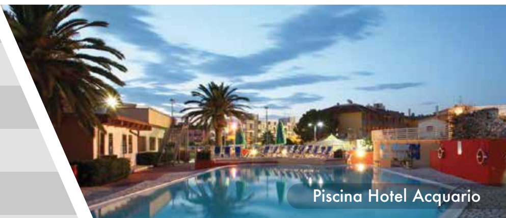
Piscina Hotel Acquario