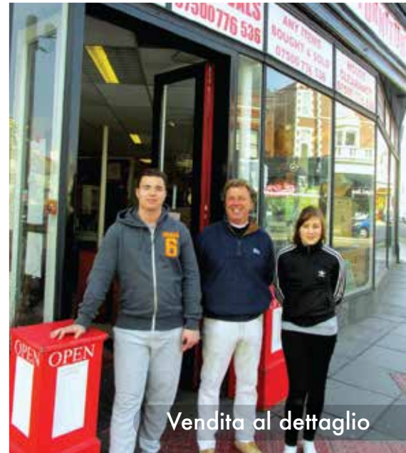
Vendita al dettaglio