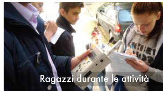
Ragazzi durante le attività